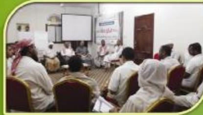
لقاء يجمع المشاركين في البرنامج مع أعضاء محفلي منهج الحلقات