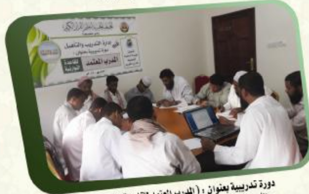
دورة تدريبية بعنوان : (المدرّب المعتمد للقاعدة النورانية) لتأهيل مدرّبين معتمدين في القاعدة النورانية بالمناطق