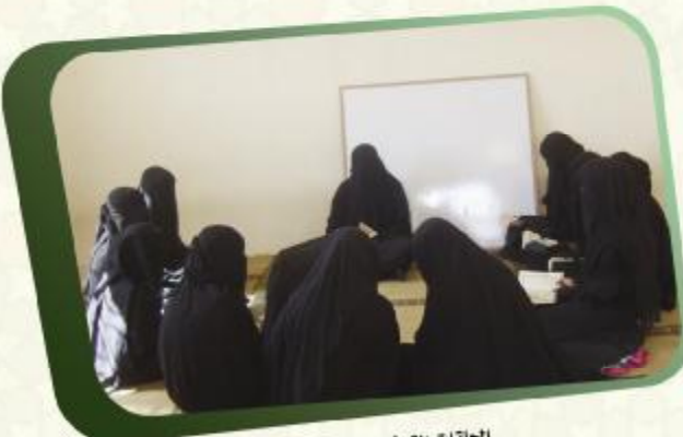
الحلقات القرآنية النموذجية