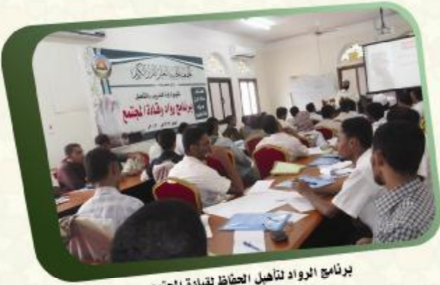
برنامج الرواد لتأهيل الحفاظ بقيادة المجتمع