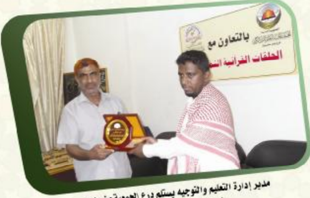
مدير إدارة التعليم والتوجيه يسلم درع الجمعية من مدير مؤسسة اقرأ الخيرية بالتحديدة