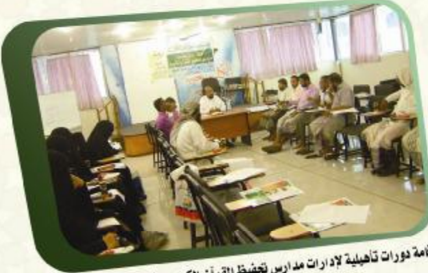
إقامة دورات تاهيلية لإدارات مدارس تحفيظ القرآن الكريم - ضمن الأنشطة والبرامج التي يدعمها القسم لتأهيل المدراء والمشرفين