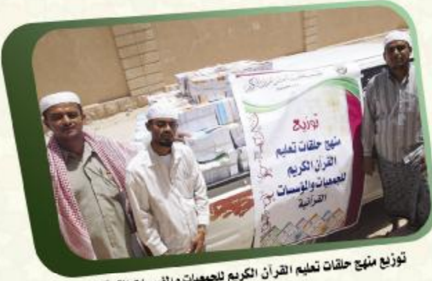
توزيع منحى حلقات تعليم القرآن الكريم للجمعيات والمؤسسات القرآنية