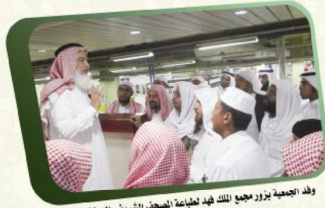
وفد الجمعية يزور مجمع الملك فهد لطباعة المصحف الشريف بالمدينة المنورة