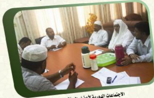
الاجتماعات الدورية لأعضاء الهيئة الإدارية