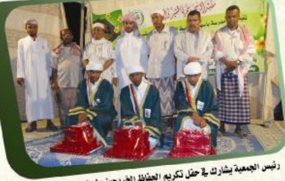
رئيس الجمعية يشارك في حفل تكريم الحفاظ الفريجين من الدورات الصيفية بمنطقة قسم - مديرية تريم