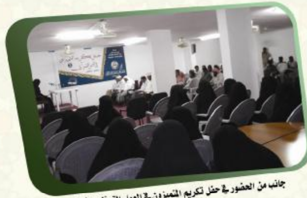
جاناب من الحضور في حفل تكريم المتميزين في العمل القرآني الثاني لعام ٢٠١٢م