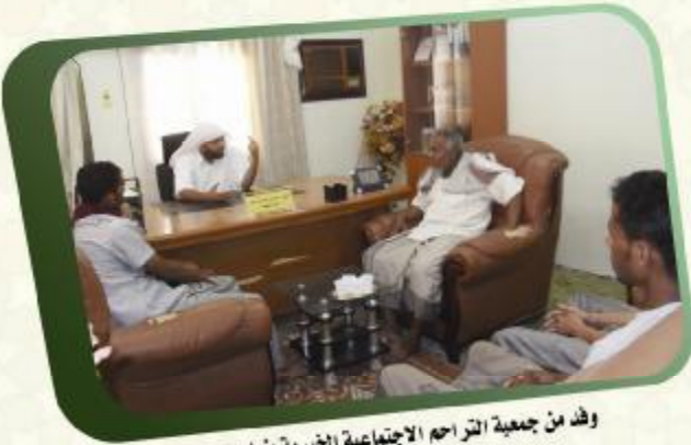
وفد من جمعية التراحم الاجتماعية الخيرية بغيل باوزير يلتقي بالمدير التنفيذي بالجمعية