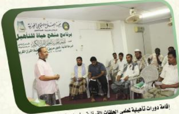
إقامة دورات تاهيلية لعلمي الحلقات القرآنية - ضمن الأنشطة والبرامج التي يدعمها القسم للمعلمين