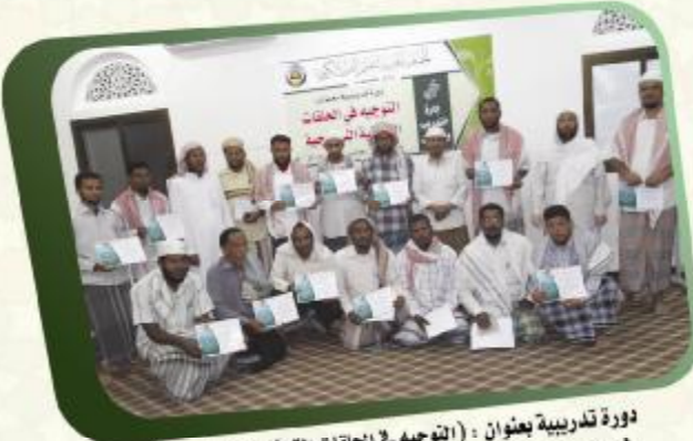
دورة تدريبية بعنوان : (التوجيه في الحلقات القرآنية النموذجية) لوجهي الحلقات بالجمعيات والمؤسسات القرآنية بوادي حضرموت