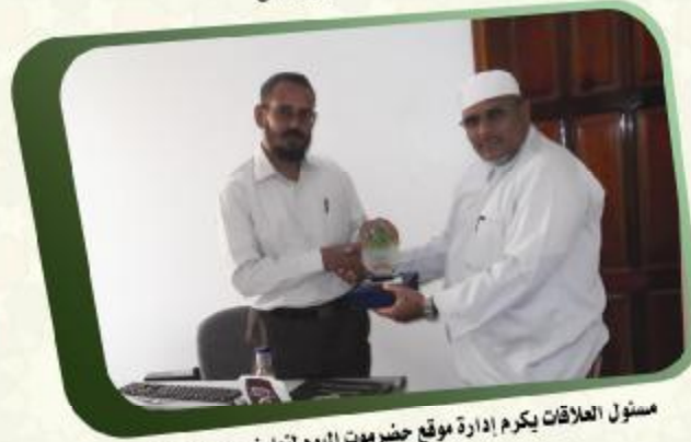
مسئول العلاقات يكرم إدارة موقع حضرموت اليوم لتعاونهم مع الجمعية في نشر فعاليات الجمعية