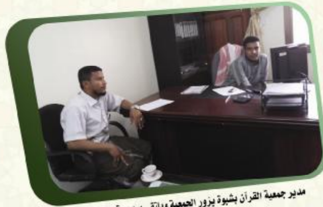
مدير جمعية القرآن بشبوة يزور الجمعية ويلتقي بمدير قسم الجمعيات والمؤسسات القرآنية