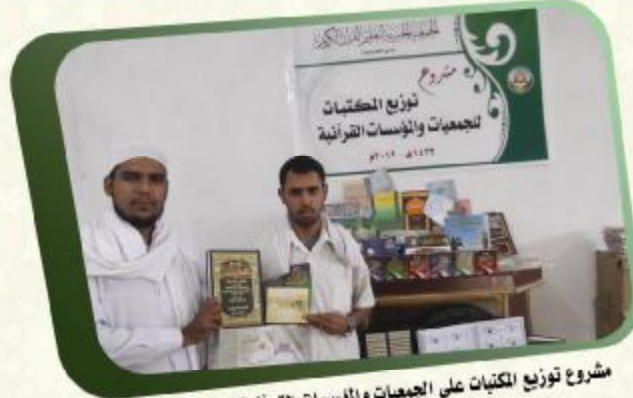
مشروع توزيع المكتبات على الجمعيات والمؤسسات القرآنية بوادي حضرموت