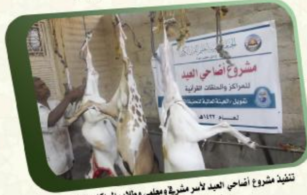
تنفيذ مشروع أضاحي العيد لأسر مشربة ومعلمي ومطاب المراكز والحلقات ممن هم من ذوي الدخل المحدود