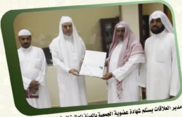
مدير العلاقات يسلم شهادة عضوية الجمعية بالهيئة العالمية لتحفيظ القرآن الكريم