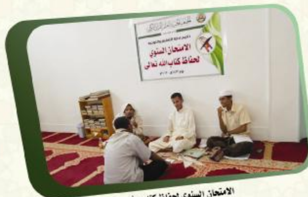
الامتحان السنوي لحفاظ كتاب الله