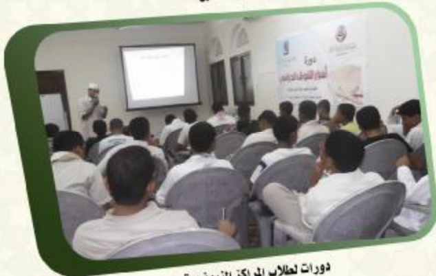
دورات لطلاب المراكز النموذجية