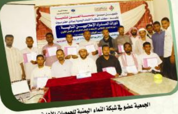
الجمعية عضو في شبكة انماء اليمنية للجمعيات الأهلية