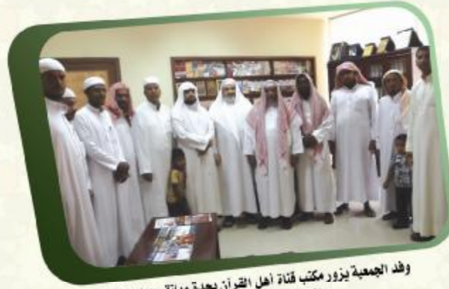
وفد الجمعية يزور مكتب قنّاة أهل القرآن بجدة ويلتقي بمديرتها الشيخ الدكتور أس كرزون