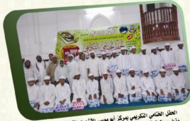
الحفل الختامي التكريمي بمركز أبو موسى الأشعري النموذجي بتريم وتخرير كوكبة من حفاظ كتاب الله، بحضور مدير وأمين عام الجمعية