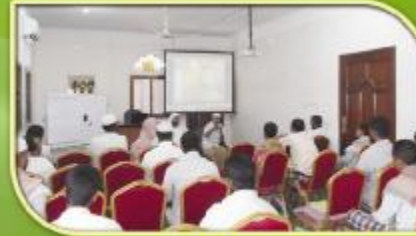
رئيس الجمعية ينقي كلمة للمشاركين في جلسة افتتاح البرنامج