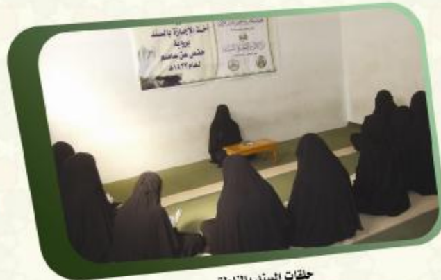
حلقات السند بالمناطق