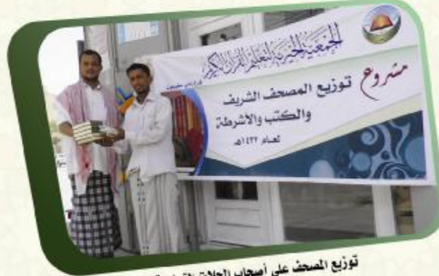
توزيع المصحف على أصحاب المحلات التجارية