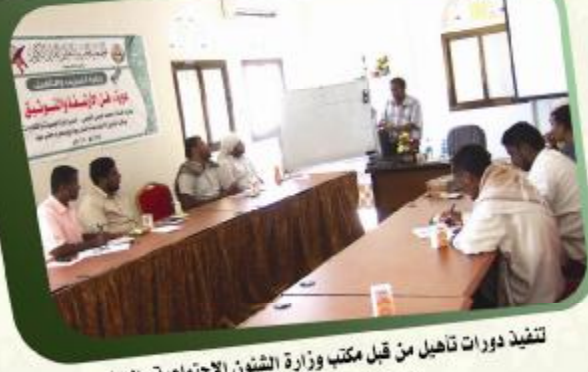
تنفيذ دورات تأهيل من قبل مكتب وزارة الشؤون الاجتماعية والعمل بوادي وصحراء حضرموت