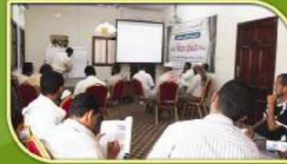
محاورة تدريبية بعنوان : ( حقيبة الإلقاء والعرض الفعال)