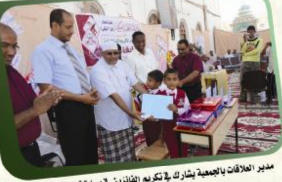
مدير العلاقات بالجمعية يشارك في تكريم الفائزين في مسابقة القرآن الكريم بمدارس الارتقاء الأهلية بسينون