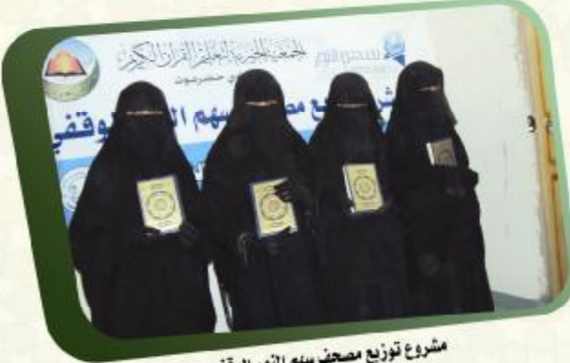
مشروع توزيع مصحف سبغ النور الوقفي