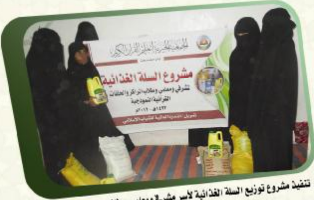
تنفيذ مشروع توزيع السلة الغذائية لأسر مشربة ومعلمي ومطاب المراكز والحلقات ممن هم من ذوي الدخل المحدود