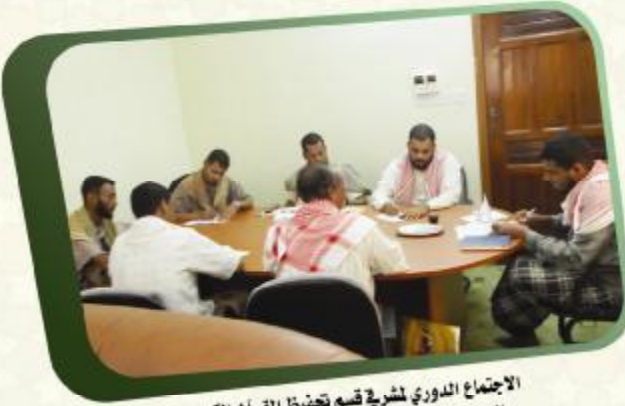
الاجتماع الدوري لشرية قسم تحفيظ القرآن الكريم بالجمعيات والمؤسسات القرآنية بوادي حزموت