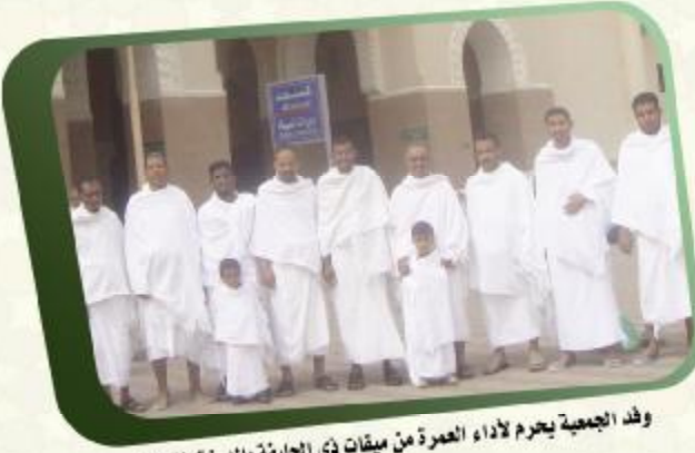
وفد الجمعية يحرم لأداء العمرة من ميقات ذي الحليفة بالمدينة المنورة