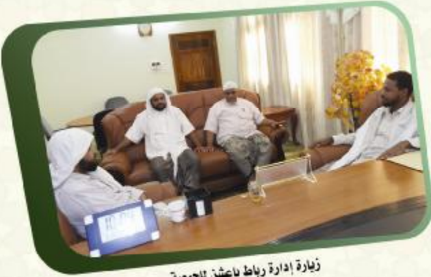
زيارة إدارة رباط باعشن للجمعية