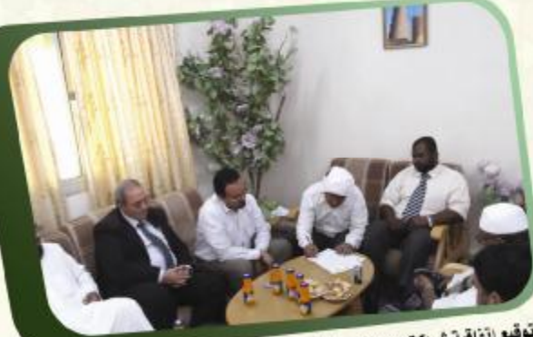
توقيع اتفاقية شراكة علمية مع جامعة حضرموت للعلوم والتكنولوجيا - كلية التربية