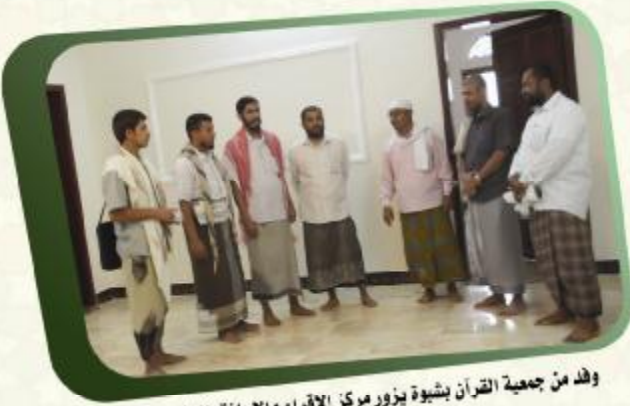
وفد من جمعية القرآن بشبوة يزور مركز الإقراء والإجازة بالسند بسبتون