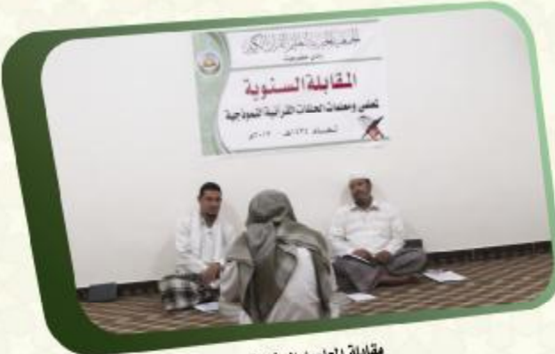
مقابلة المعلمين السنوية