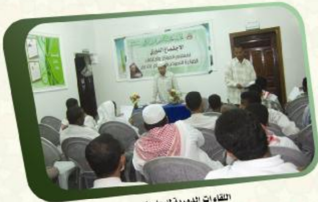
اللقاءات الدورية للمعلمين