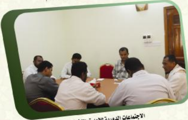
الاجتماعات الدورية للإدارة التنفيذية