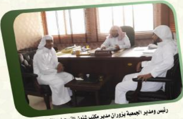
رئيس ومدير الجمعية يزوران مدير مكتب شئون التسجيل والقبول بالجامعة الإسلامية بالمدينة المنورة