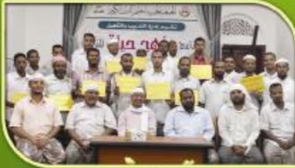
صورة جماعية للمشاركين مع أعضاء الهيئة الإدارية بالجمعية

تأهيل (٢٠) مدرباً لمنهج حلقات تعليم القرآن الكريم بمحافظة حضرموت .