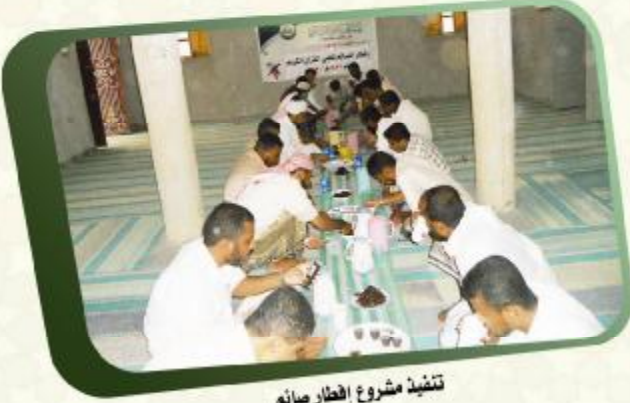
تنفيذ مشروع افطار صائمه