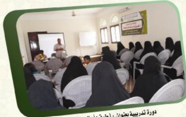
دورة تدريبية بعنوان : (طرق وأساليب المراجعة) لعللمات الحلقات القرآنية النموذجية بوادي حضرموت