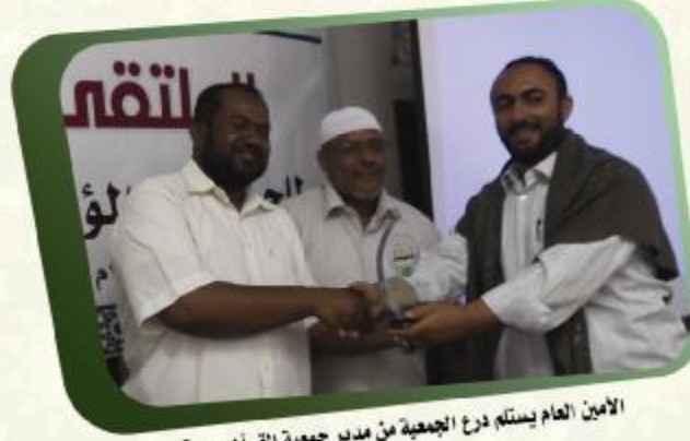
الأمين العام يسلم درع الجمعية من مدير جمعية القرآن بريمة