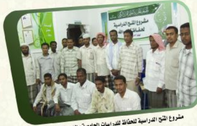
مشروع المنح الدراسية للحفاظ للدراسات الجامعية والدرجات العليا