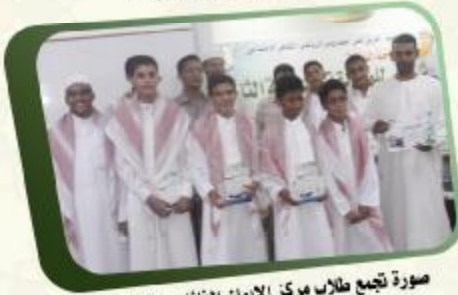
صورة تجمع طلاب مركز الإيمان الفائزون في المسابقة مع إدارة ومدرسو المركز