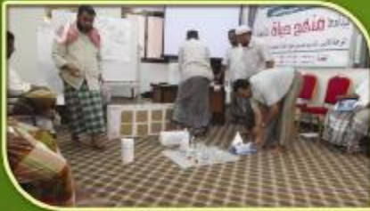
إعداد وسائل تعليمية من قبل المشاركين في البرنامج