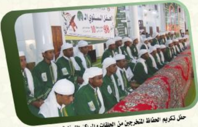
حفل تكريم الحفاظ المتخرجين من الحلقات والمراكز القرآنية النموذجية