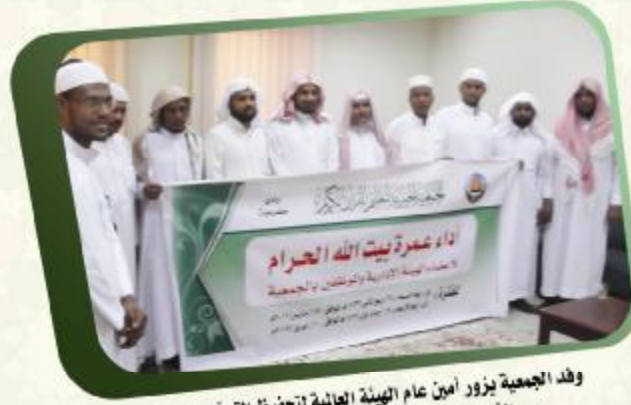
وفد الجمعية يزور أمين عام الهيئة العالمية لتحفيظ القرآن الكريم الشيخ الدكتور عبد الله بن علي بصفر بجدة