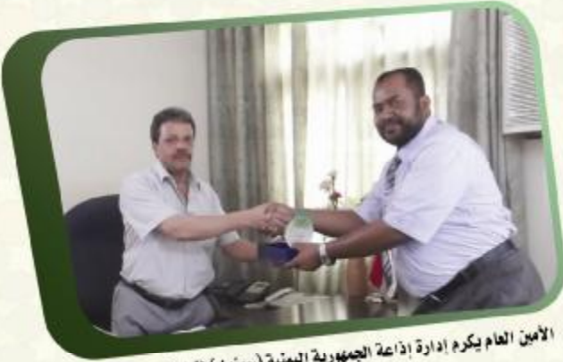
الأمين العام يكرم إدارة إذاعة الجمهورية اليمنية (سينون) لتعاونهم مع الجمعية في نشر فعاليات الجمعية