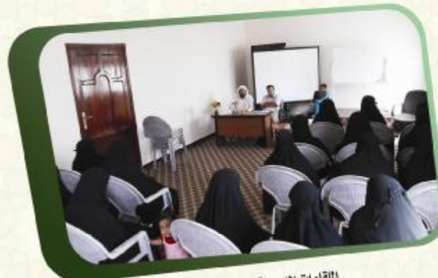
اللقاءات الدورية للمعلمين والمعلمات