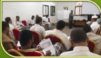
محاورة تدريبية بعنوان : ( حقيبة الوسائل التعليمية)