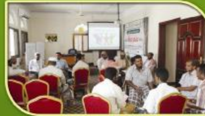
(ورش عمل - حلقات نقاشية) للمشاركين أثناء المحاضرات