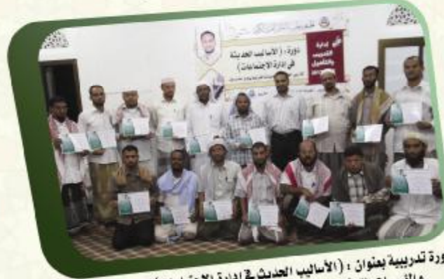
دورة تدريبية بعنوان : (الأساليب الحديثة في إدارة الاجتماعات) لإداريي الجمعيات والمؤسسات القرآنية ومدراء المكاتب والمراكز القرآنية بوادي حضرموت