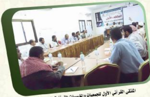
الملتقى القرآني الأول للجمعيات والمؤسسات القرآنية بالجمهورية