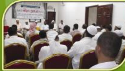
مشاركة أعضاء الهيئة الإدارية بالجمعية في جلسة احتتام البرنامج