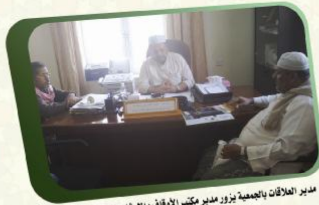
مدير العلاقات بالجمعية يزور مدير مكتب الأوقاف والإرشاد بالوادي والصحراء