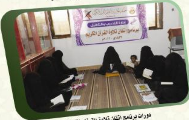
دورات برنامج إتقان تلاوة القرآن بالمناطق