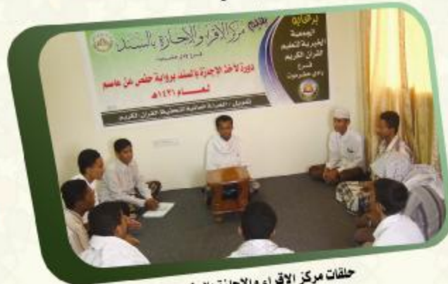
حلقات مركز الإقراء والإجازة بالسند