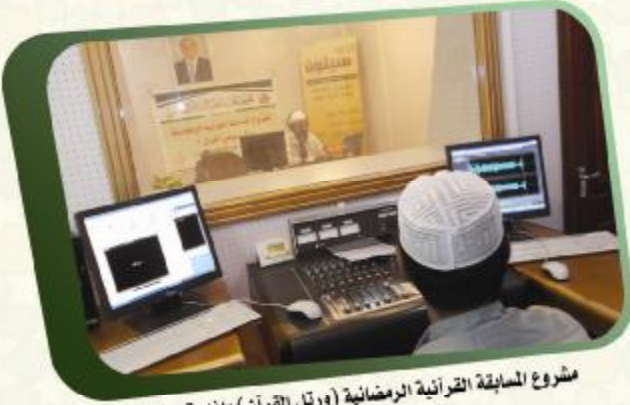
مشروع المسابقة القرآنية الرمضانية (وترل القرآن) بإذاعة سينون