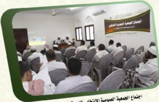
اجتماع الجمعية العمومية الانتخابي للدورة الرابعة لعام ٢٠١٢م

ولما تقدمه الجمعية من أعمال متميزة في خدمة القرآن الكريم نالت الجمعية الخيرية لتعليم القرآن الكريم -اليمن جائزة أفضل مؤسسة لخدمة القرآن الكريم عالمياً في عام ١٤٢٨هـ من قبل الهيئة العالمية لتحفيظ القرآن الكريم ووزارة الأوقاف الكويتية .