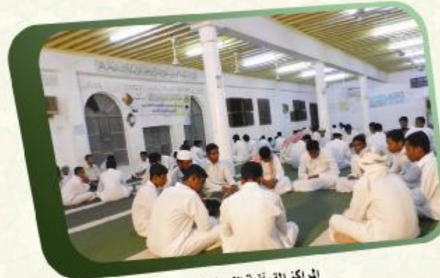
المراكز القرآنية النموذجية