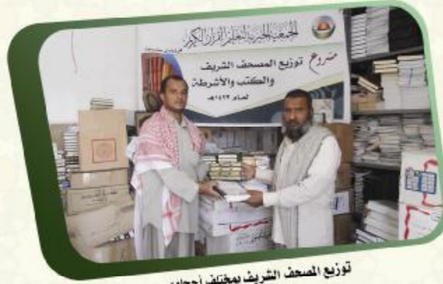
توزيع المصحف الشريف بمختلف أجهامه