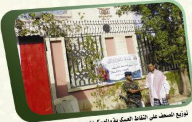
توزيع المصحف على النقاط العسكرية والمسكرات وحراسات المرافق الحكومية