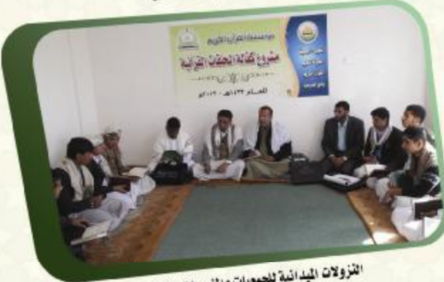
الفرزوات الميدانية للجمعيات والمؤسسات القرآنية