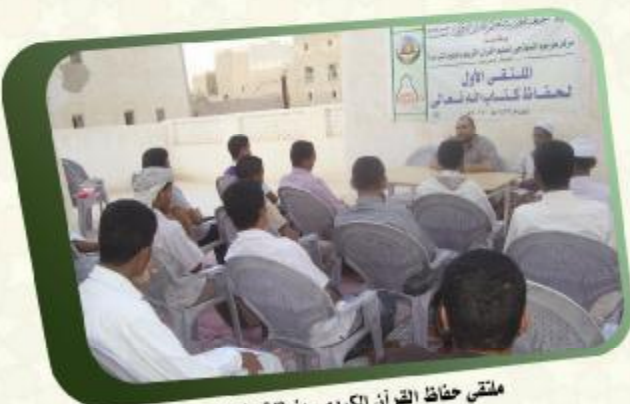
ملتقى حفاظ القرآن الكريم - منطقة العرقبة