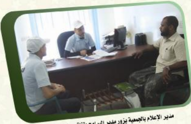
مدير الإعلام بالجمعية يزور مدير البرامج بقناة سهيل الفضائية