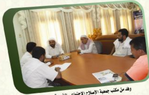
وفد من مكتب جمعية الإصلاح الاجتماعي الخيرية بدوعن يزور الجمعية ويلتقي بالمدير التنفيذي