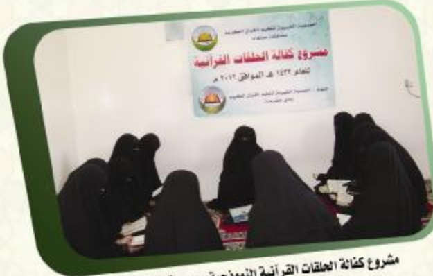
مشروع كفاة الحلقات القرآنية النموذجية - جمعية القرآن بصنعاء