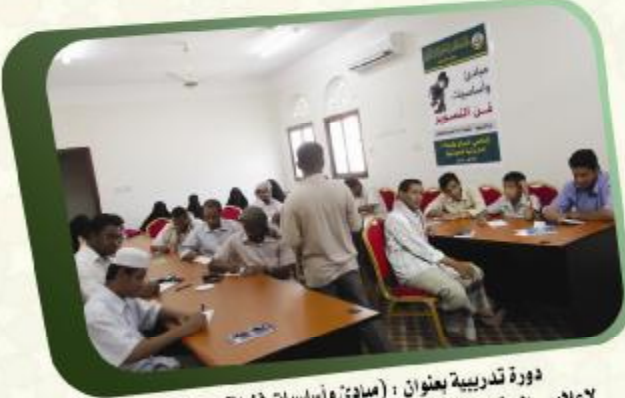
دورة تدريبية بعنوان : (مبادئ وأساسيات فن التصوير) لإعلاميي المراكز والحلقات القرآنية النموذجية والمكاتب التابعة للجمعية