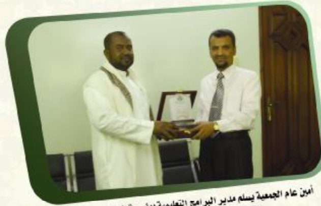
أمين عام الجمعية يسلم مدير البرامج التعليمية بمؤسسة العون درع الجمعية للتعاون في مشروع الوسائل العلمية والمناهج