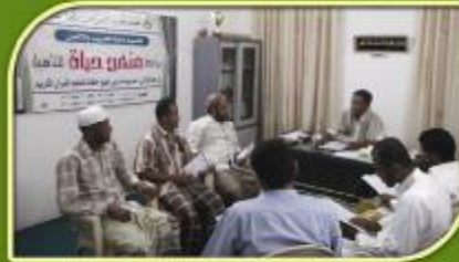
زيارات ميدانية قام بها المشاركون إلى عدد من إدارات الحلقات